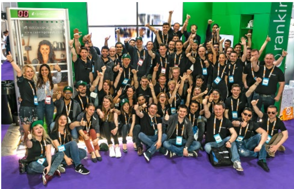
Equipo de rankingCoach